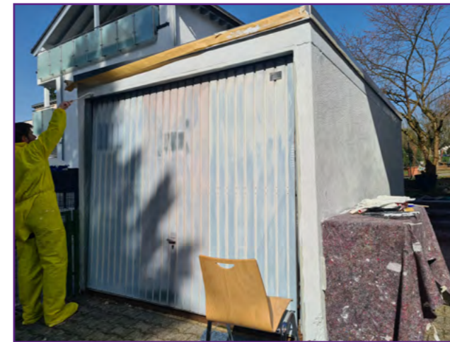
Garagenanstrich im Rahmen von "Johannes packt an"

Wie in der Gemeindeversammlung am 08. März vorgestellt, bilden wir gemeinsam mit den Kirchengemeinden aus Langenhain, Lorsbach, Diedenbergen, Bremthal, Kriftel und Marxheim ab dem 01. Januar 2027 die „Ev. Gesamtkirchengemeinde am Taunus“. Aktuell liegt die Satzung zur Genehmigung in Darmstadt – wir bereiten derweil schon den neuen gemeinsamen Haushalt vor. Außerdem beginnen nun die Überlegungen für den ersten Gesamtkirchenvorstand – zunächst für den Übergang bis zur Kirchenvor-