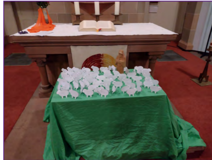
Osternacht für Familien