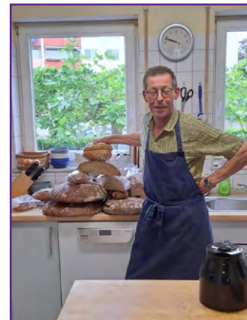
Brotspende für das Obdachlosen- Haus St. Martin in Hattersheim

Dieses Bild finden Sie in der gedruckten Version des Johannesbriefs