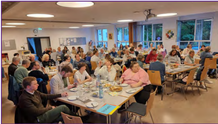
Weinprobe der Johannesfreunde

Dieses Bild finden Sie in der gedruckten Version des Johannesbriefs